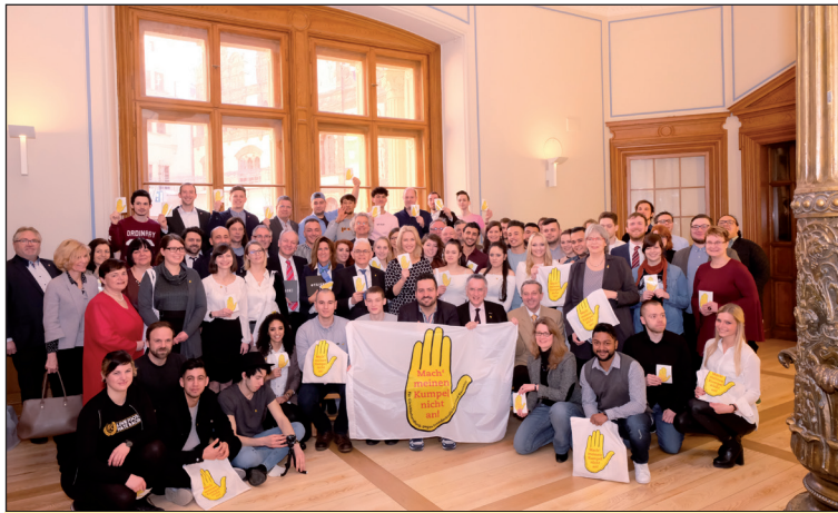
Die Preisträgerinnen und Preisträger des Wettbewerbs „Die Gelbe Hand“ 2017/18